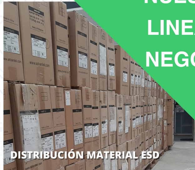
DISTRIBUCIÓN MATERIAL ESD