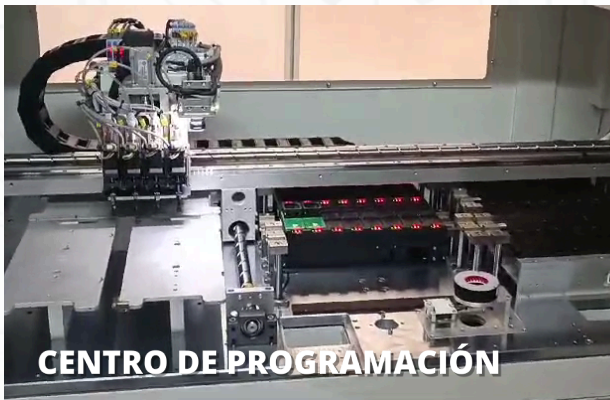
CENTRO DE PROGRAMACIÓN